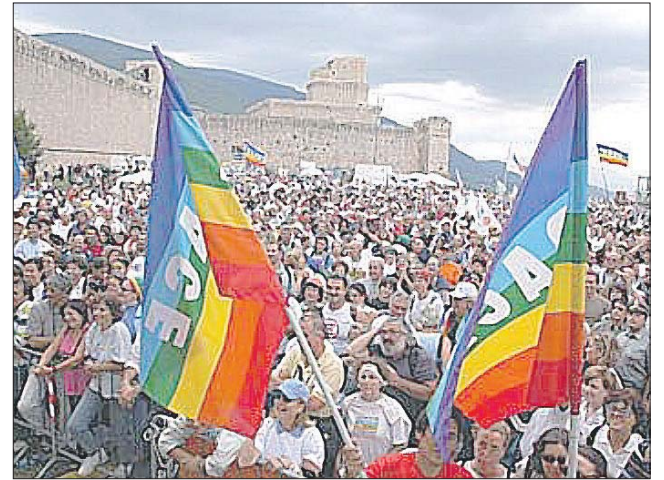
L'evento Migliaia di persone arriveranno da tutta Italia per prendere parte alla manifestazione nata sulla spinta delle idee pacifiste di Aldo Capitini

Disposta la chiusura delle vie interessate dagli eventi Ecco come cambia la viabilità per le due gare ciclistiche di oggi e la Marcia della pace di domani