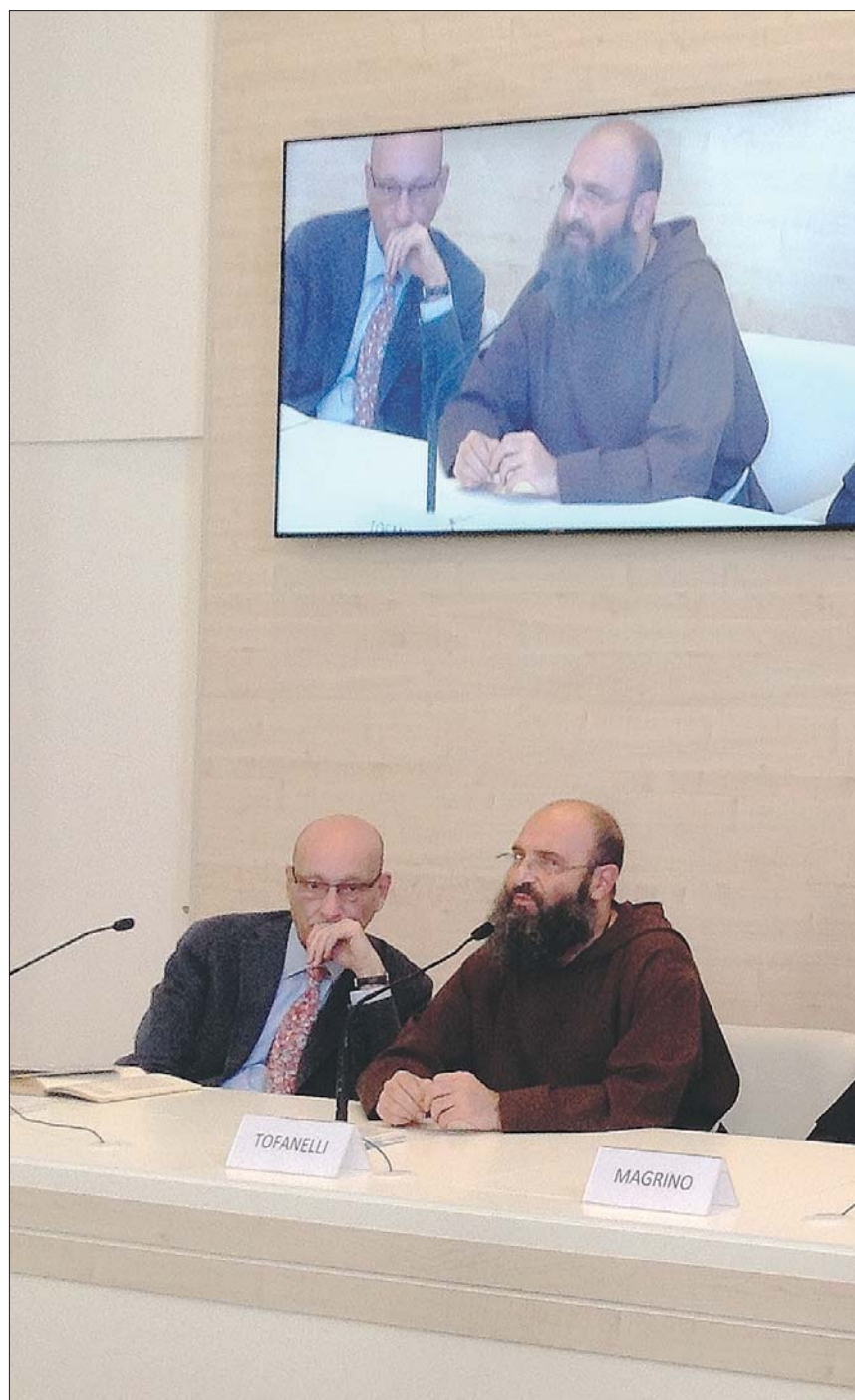
La presentazione dell'evento è avvenuta a San Francesco alla presenza delle varie Famiglie francescane che hanno risposto entusiasticamente a questa manifestazione

▶ ASSISI - Presentata nella sala stampa del Sacro Convento la rassegna internazionale di musica sacra francescana "Assisi: pax mundi" in programma da giovedì a domenica prossimi ad Assisi. All'evento, promosso dalle Famiglie Francescane in collaborazione con la Cappella Musicale della Basilica di San Francesco, parteciperanno 16 cori italiani ed europei, circa 400 coristi in tutto, per una quattro giorni di musica, fraternità e dialogo. Lo scopo è promuovere la cultura della musica sacra, in particolare quella legata al mondo francescano. "Attraverso l'incontro dei gruppi corali e strumentali è possibile accrescere una cultura di pace e di collaborazione tra popoli e culture diverse nello spirito di Assisi - hanno affermato padre Antonio Maria Tofanelli e padre Maurizio Verde - tante voci unite nel dialogo arricchiscono la persona a livello culturale". In programma 11 concerti, circa venti ore di musica, con la speranza in futuro di aprire anche ad altri generi musicali e la mostra "Arte e scienza nella musica dei frati minori conventuali" visitabile presso il Museo del Tesoro fino al 31 ottobre. "Le musiche che verranno eseguite vanno dal '200 ai giorni nostri - ha affermato padre Giuseppe Magrino, di-